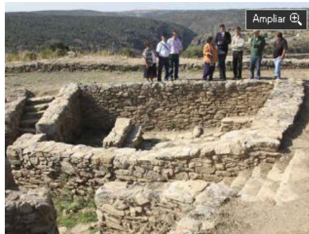
Fuerte Nuevo de Torregamones, situado en la frontera con Miranda do Douro.