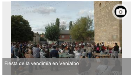
Fiesta de la vendimia en Venialbo