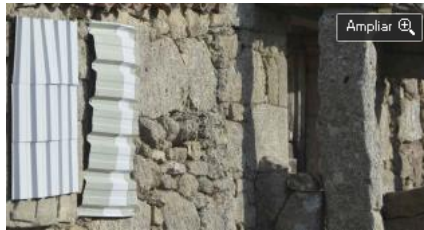
Chapas instaladas para cubrir las tallas de la pared.

La leyenda, según ha referido en ocasiones Alfonso Domingo, viene a ser una trifulca familiar que se saldó de modo artístico. Tras una discusión a voces, y luego con un cantado de Clara a Hércules, éste gritó que "te he de poner donde más te vean", y de este modo petrificó el tenso momento vivido petrificando a Clara en una de las jambas de la puerta de entrada a la casa, y a Hércules en la otra jamba. Es una escenografía llamativa, que los vecinos consideran un aliciente capaz de animar los encantos de una población enclavada en pleno Parque Natural de Arribes del Duero. Un motivo más que añadir a otros patrimonios como puedan ser Los Chiviteros y el mismo Fuerte Nuevo, que algunos consideran un reducto. Alfonso Domingo siempre hizo mención a un cierto agobio por parte de personas que no respetaban a un hombre amante de las faenas del campo y de una existencia tranquila.